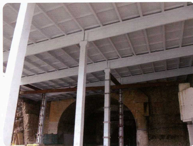
Рис. 2. Состояние конструкций навеса до и после выполнения ремонтно-восстановительных мероприятий

На втором этапе работ проведена расчистка кровли от остатков существующего гидроизоляционного ковра и выполнена выравнивающая стяжка из цементно-песчаного раствора. После покрытия стяжки битумным праймером по всей поверхности кровли уложен двухслойный кровельный ковер с использованием материала «Техноэласт» [4]. В месте примыкания к горному массиву ковер был поднят на 200 мм на подпорную стенку, заведен в штрабу и загерметизирован. Примыкание было проинъектировано гидроактивным полиуретановым составом.